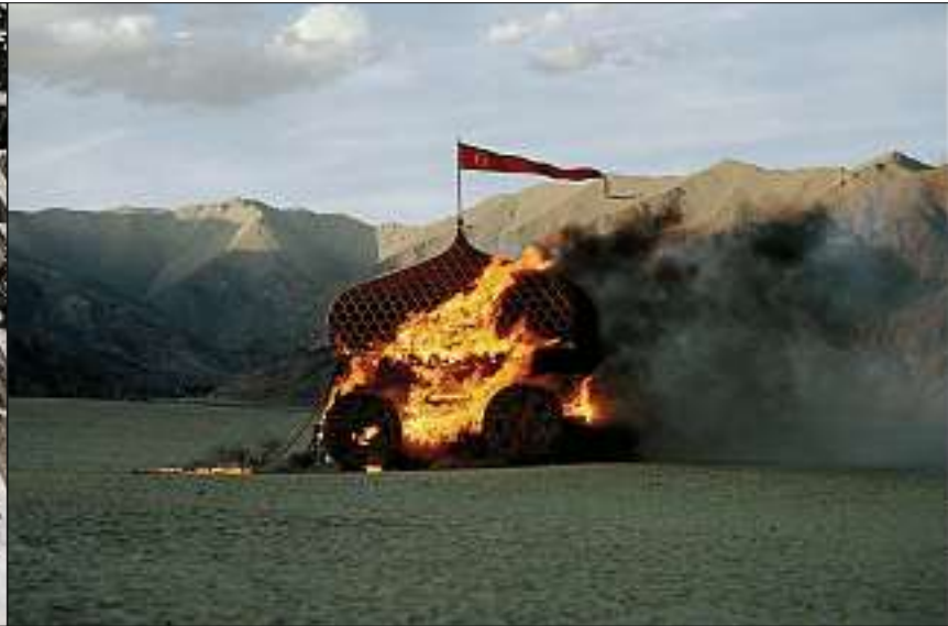
Heiße Sache: THE FALL entstand an Locations in über 20 Ländern und wirkt auf den Zuschauer wie ein tripartiges, halluzinogenes Märchen

seine dritte Tolstoi-Bearbeitung abgeliefert, in der abermals Hollywood-Star Danny Huston brilliert (mit einem Cameo von Halbschwester Anjelica Huston). Edgar Hudson (Huston) ist ein reicher und charmanter Philanthrop, der eine Affäre mit der talentierten Pianistin Abby (Elisabeth Röhm) beginnt und sie zu seiner Frau macht, als sie schwanger wird. Während Eds Stern weiterhin glänzt, fühlt sich Abby bald nur noch als attraktive Attrappe, die ihre eigene Karriere zwecks Mutterschaft zurückstellen muß. Als Ed eines Tages eine Dinnerparty hält, lernt Abby den Violinisten Arden kennen, der sie von jetzt an öfters besuchen kommt um mit ihr Beethovens Kreuzersonate zu praktizieren. Endlich fühlt sich Abby wieder künstlerisch gefordert, doch ihr Ehemann wird zunehmend besitzergreifend. Schließlich kommt es, wie es kommen muß, und Eds eifersüchtiger Herzschlag beginnt, einem „A Minor Presto“ zu ähneln ... THE KREUTZER SONATA ist ein sehr reifes und dunkles Werk, das gekonnt die Komposition einer modernen Ehe offenlegt.