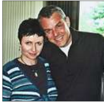
Belesen: Regisseur Danny Huston (r.) mag's gerne literarisch