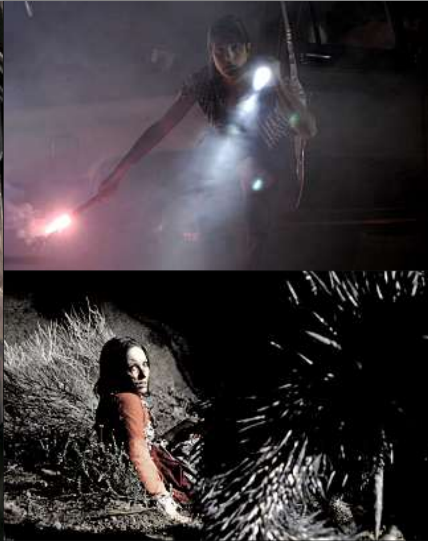
Ein ungewöhnliches phantastisches Märchen: SPIKE von Robert Beaucage wurde auf dem Festival von Edinburgh als Weltpremiere gezeigt

wurde von US-Newcomer Robert Beaucage originell und einfühlsam umgesetzt. Edward Gusts spielt Spike, eine mißverständene Kreatur, die man als menschliches Stachelschwein bezeichnen könnte. In einer düsteren, von finsternem Wald umgebenen Landschaft bleibt ein Auto stecken, und mit der Karre ein Lesbenpärchen, ein Machotrottel sowie das „Mädchen“ - die alle (mehr oder weniger) mit der Kreatur in Berührung kommen. Doch was