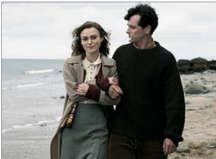
THE EDGE OF LOVE Vera Phillips (Keira Knightley) fühlt sich dem Dichter Dylan Thomas (Matthew Rhys) seit ihrer Jugendzeit eng verbunden

Als großer Publikumshit erwies sich DEATH DEFYING ACTS , ein nostalgischer Trip von Regisseur Gillian Armstrong, der die Zuschauer ins Edinburgh des Jahres 1926 zurückversetzt. Guy Pearce verkörpert den berühmten Entfesselungskünstler Houdini, der am Ende seiner Tournee in der schottischen