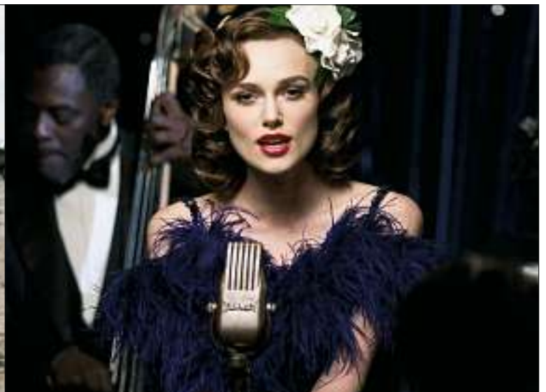
Emotionales Chaos: Sängerin Vera (Keira Knightley) steht zwischen dem Mann, welchen sie geheiratet hat, und dem Mann, den sie liebt